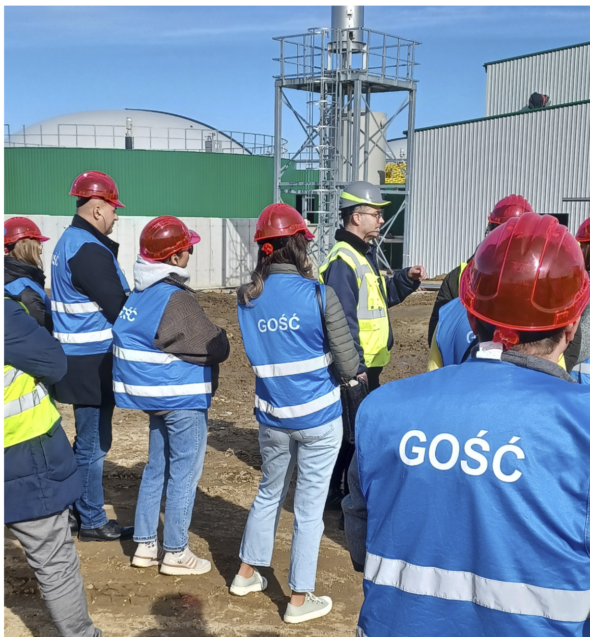
Budowa biogazowni ZGOK – to tutaj odpady kuchenne zostaną przetworzone na energię elektryczną, ciepłą i nawóz

Odpady KUCHENNE odbierane są raz w tygodniu zarówno w zabudowie jedno-, jak i wielorodzinnej.