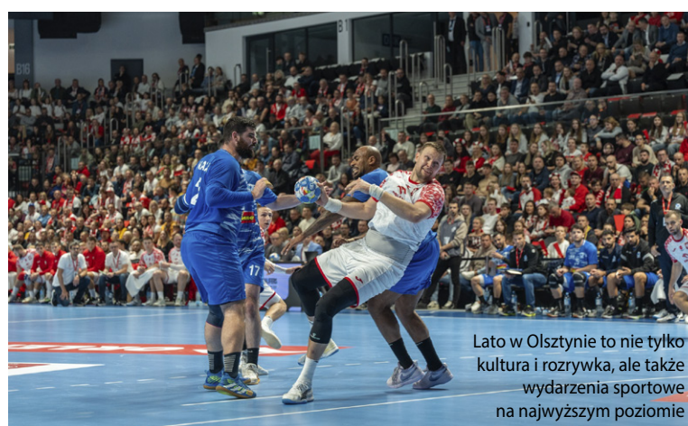
Lato w Olsztynie to nie tylko kultura i rozrywka, ale także wydarzenia sportowe na najwyższym poziomie

Latem Olsztyński Teatr Lalek zaprosi publiczność na XXI Między-