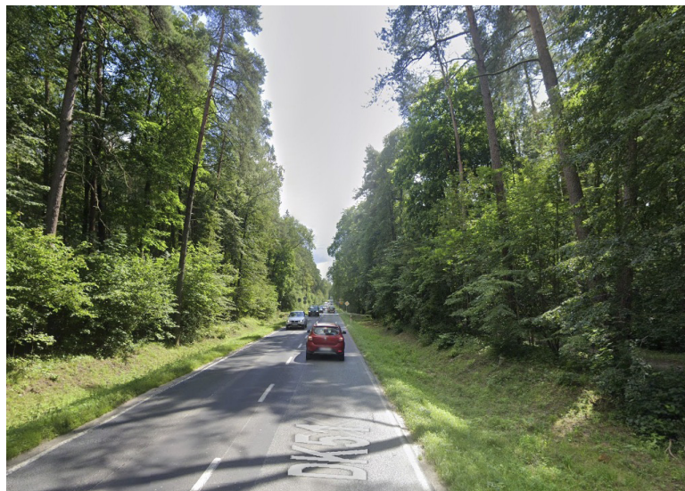
Odcinek leśny alei Wojska Polskiego to obecnie najgorszy wjazd do stolicy regionu. Natężenie ruchu na odcinku Olsztyn-Dywity wzrosło w ciągu ostatnich 5 lat o 40 procent

Wniosek wójta gminy Dywity do prezydenta Olsztyna wzmocnili swoim stanowiskiem przyjętym na sesji w dniu 29 maja 2026 radni gminy Dywity. Za stanowi-