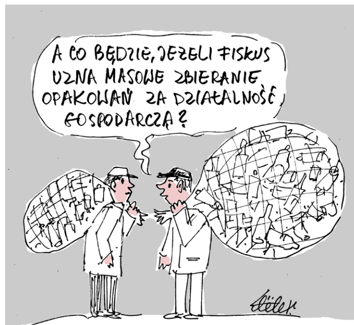
Rys. Zbigniew Piszczako