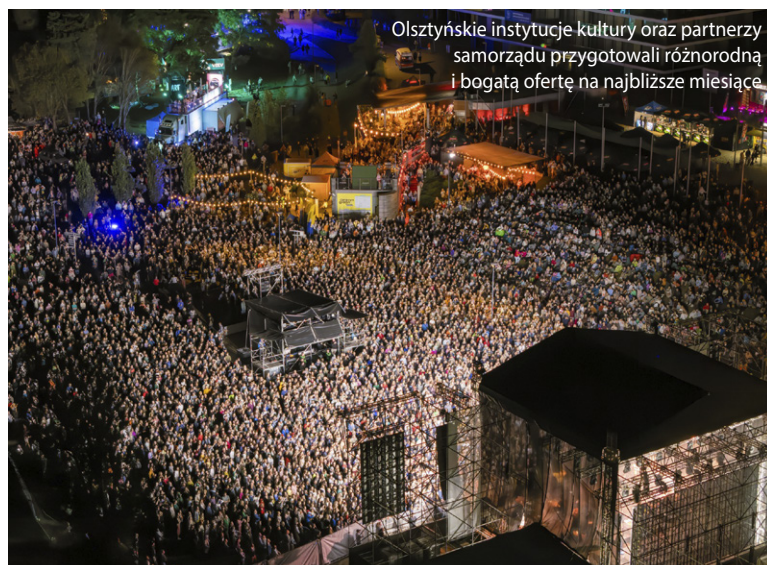
Olsztyńskie instytucje kultury oraz partnerzy samorządu przygotowali różnorodną i bogatą ofertę na najbliższe miesiące.

Wśród najważniejszych koncertów znalazły się: Spięty (5 lipca), Le-