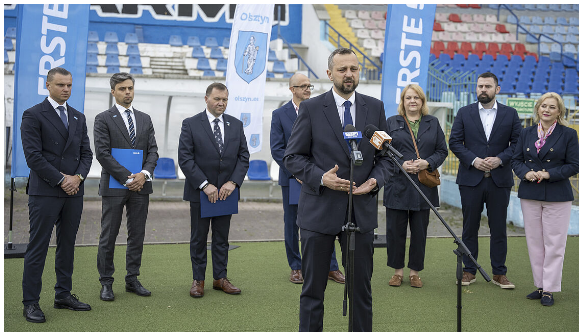
Podpisanie umowy na finansowanie to jeden z kluczowych kroków prowadzących do budowy nowego stadionu miejskiego

– Rok temu ogłosiłem budowę nowego stadionu, ponieważ miesz-