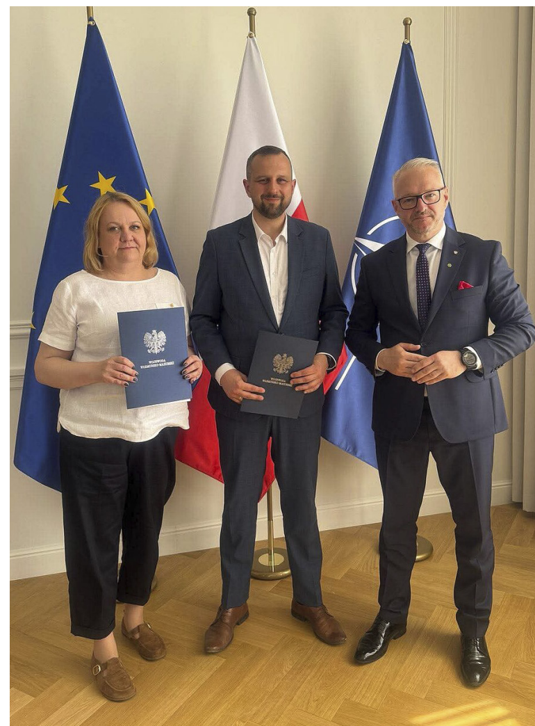
Dzięki dofinansowaniu Olsztyn w przemyślany sposób wzmocni zasoby na wypadek sytuacji kryzysowych

Olsztyn od lat dysponuje doskonale wyposażonym magazynem Regionalnego Centrum Bezpieczeństwa – to sprzęt wartości ok. 10 mln złotych wykorzystywany w nagłych wypadkach, ale także wspierający codzienne działania służb odpowiedzialnych za bezpieczeństwo. Takiego komfortu nie ma żadne inne miasto naszego województwa.