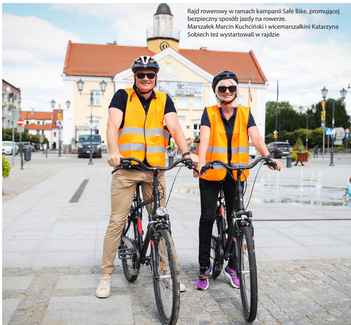
Rajd rowerowy w ramach kampanii Safe Bike, promującej bezpieczny sposób jazdy na rowerze. Marszałek Marcin Kuchciński i wicemarszałkini Katarzyna Sobiech też wystartowali w rajdzie

Podpisanie umów poprzedził rajd rowerowy w ramach kampanii Safe Bike. Jego uczestnicy pokonali pięciokilometrową trasę z Nidzicy do Rozdroża, przypominając o bezpiecznych zachowaniach przed